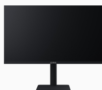
Монитор «Сова» OM2381