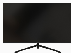
Монитор «Сова» OM3151